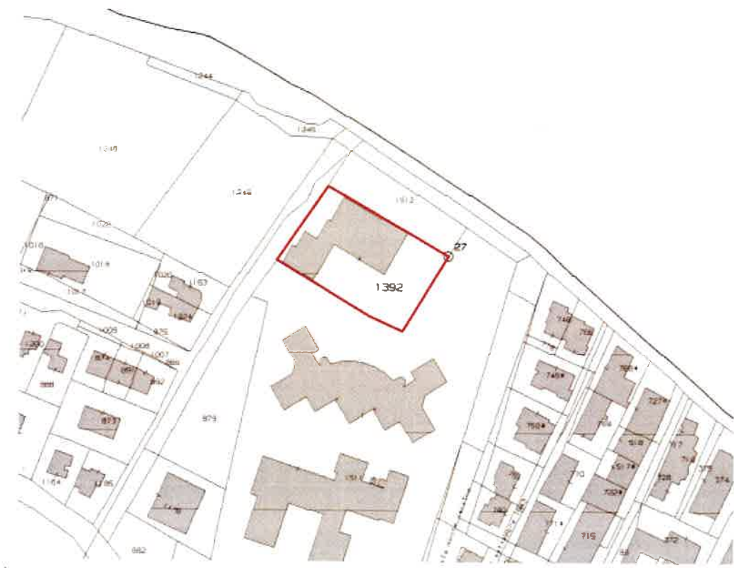
ESTRATTO MAPPA CATASTALE RAGUSA