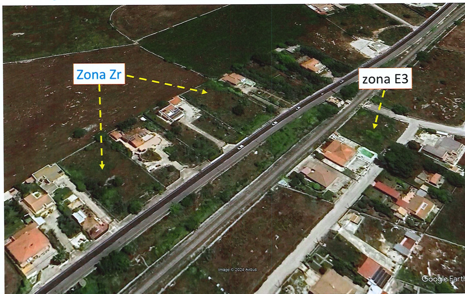
Figura 6 – il contesto di recupero di appartenenza con indicazione delle destinazioni date a lotti liberi interclusi