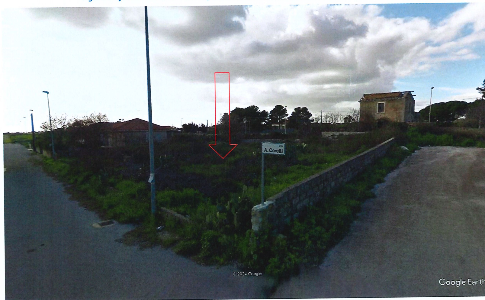
Figura 4 – foto dell'area dove emerge l'esistenza delle strade e della pubblica illuminazione