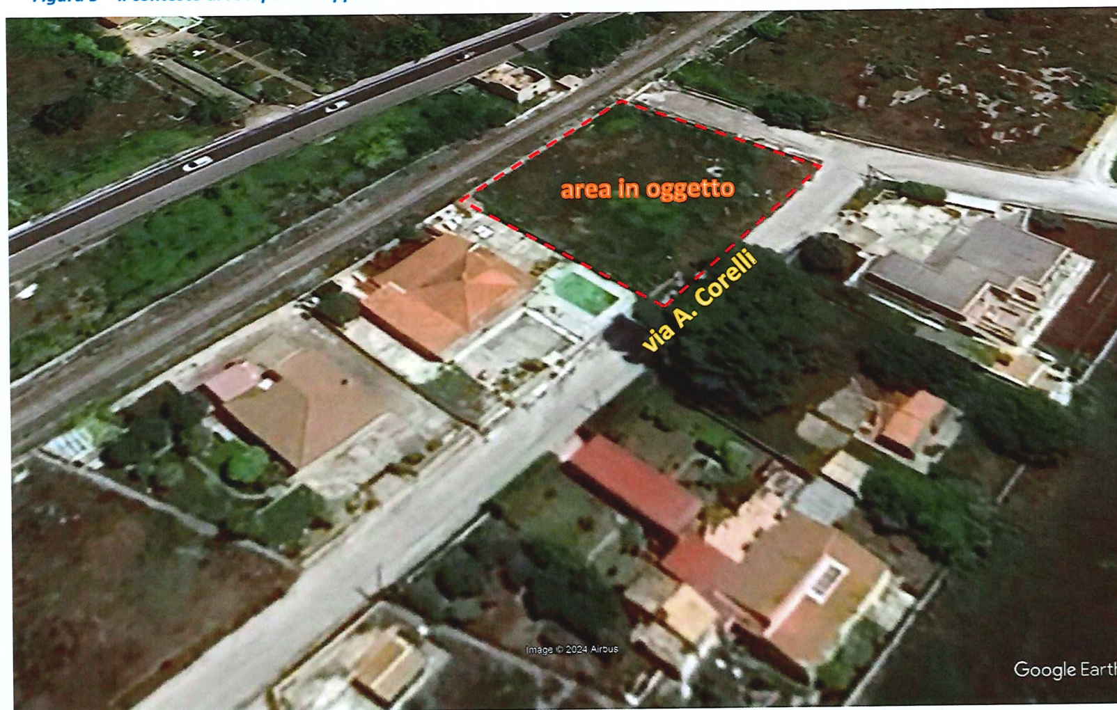
Figura 5 – il contesto di recupero di appartenenza con la evidente condizione di lotto intercluso dell'area oggetto dell'osservazione