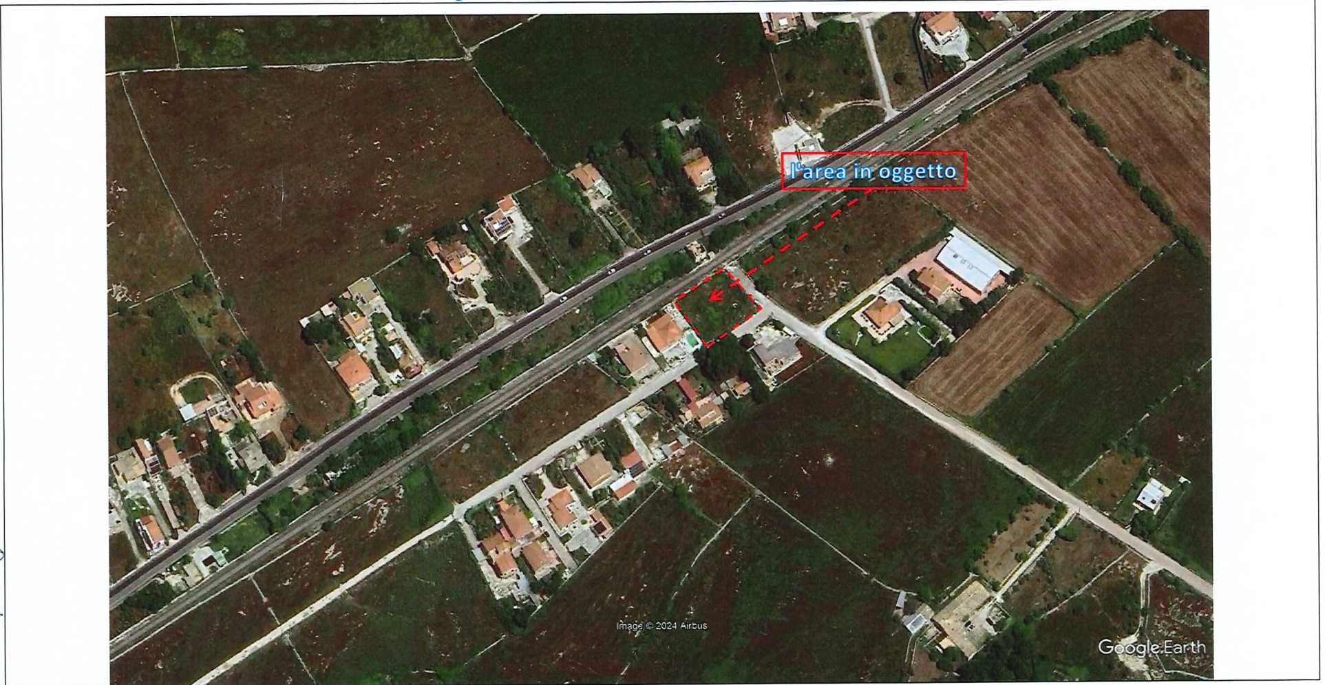
Figura 3 – vista dell'area e del suo contesto su google