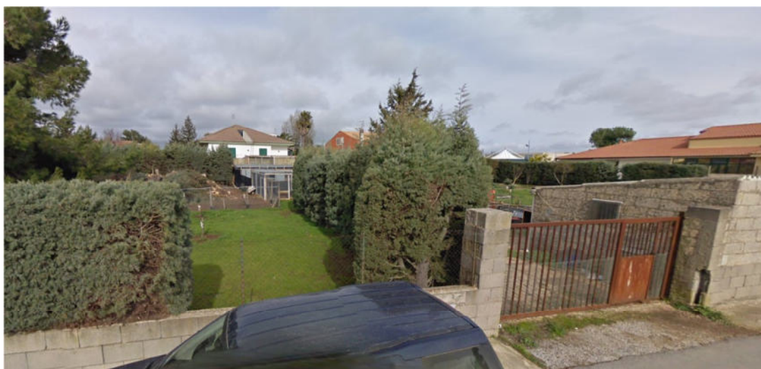
FOTO N.1 VISTA DEL LOTTO DA VIA CIMABUE