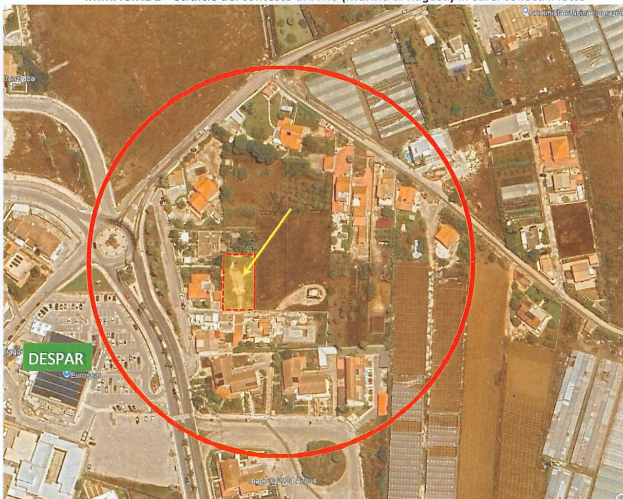
IMMAGINE 1 – stralcio del contesto urbano (Marina di Ragusa) in cui si colloca il lotto

L'area oggetto di osservazione, identificata in catasto al foglio 276 part. 576, nel PRG, costituisce un lotto di terreno racchiuso tra unità edilizie esistenti all'interno del sistema urbano di Marina di Ragusa , in un contesto urbanizzato e dotato di tutte i servizi di acquedotto, fognatura, reti elettriche e telefoniche, pubblica illuminazione, a meno di 100 metri dal supermercato DESPAR, e a circa 200 metri dalle attrezzature scolastiche e sportive del quartiere e dalla locale caserma dei carabinieri.