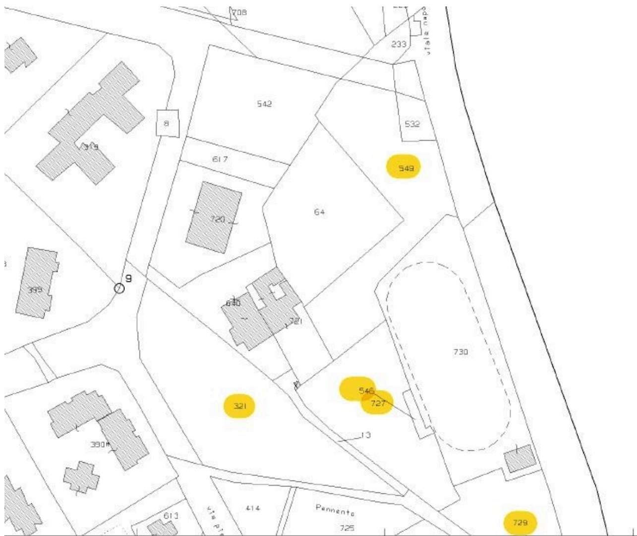
STRALCIO MAPPA CATASTALE FOGLIO 100