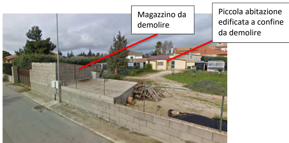
Foto n.1 - Vista del lotto da via Cimabue