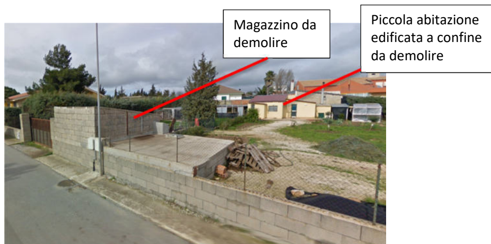
Foto n.1 - Vista del lotto da via Cimabue