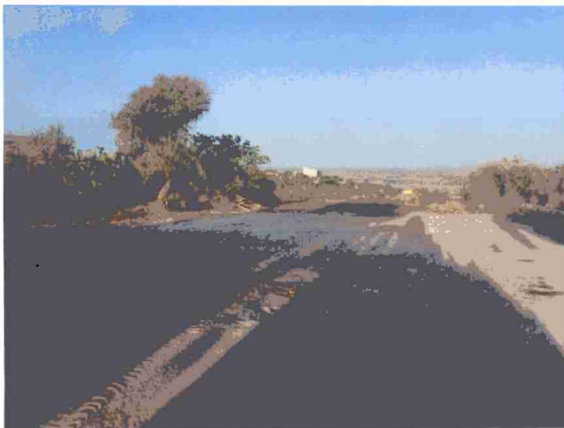
Foto 5 – stato dei luoghi ad oggi, a seguito della demolizione dell'immobile