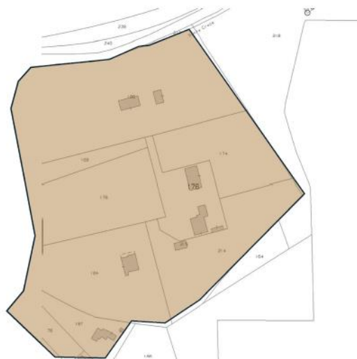
Osservazione Antoci n. 124