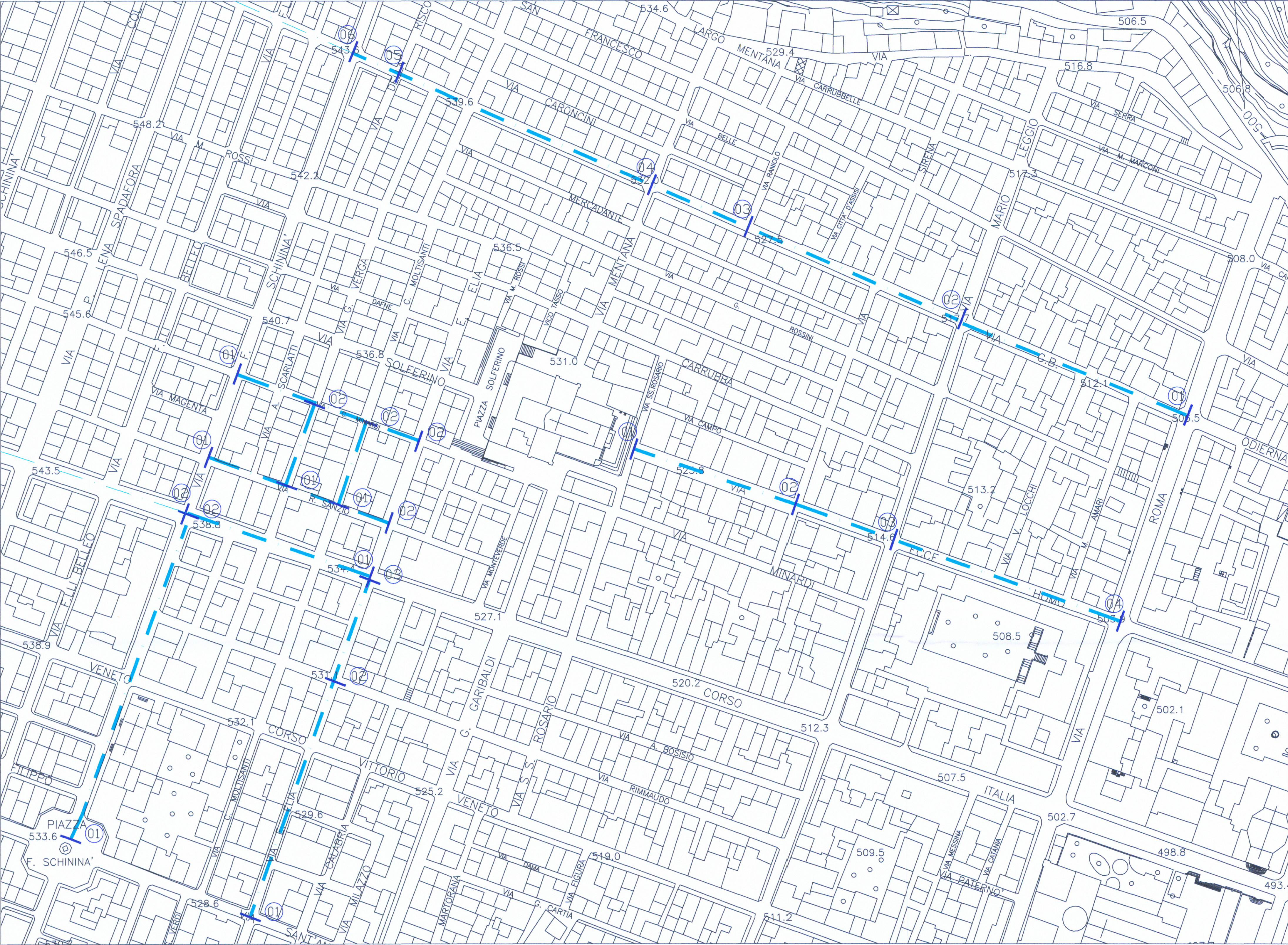
STRALCIO PLANIMETRICO SCALA 1:1000

17 C.SO ITALIA TRATTO: F.SCHININA' - M.SCHININA' 18 TRATTO: M.SCHININA' - GAGINI 19 TRATTO: E. ELIA - F. SCHININA'