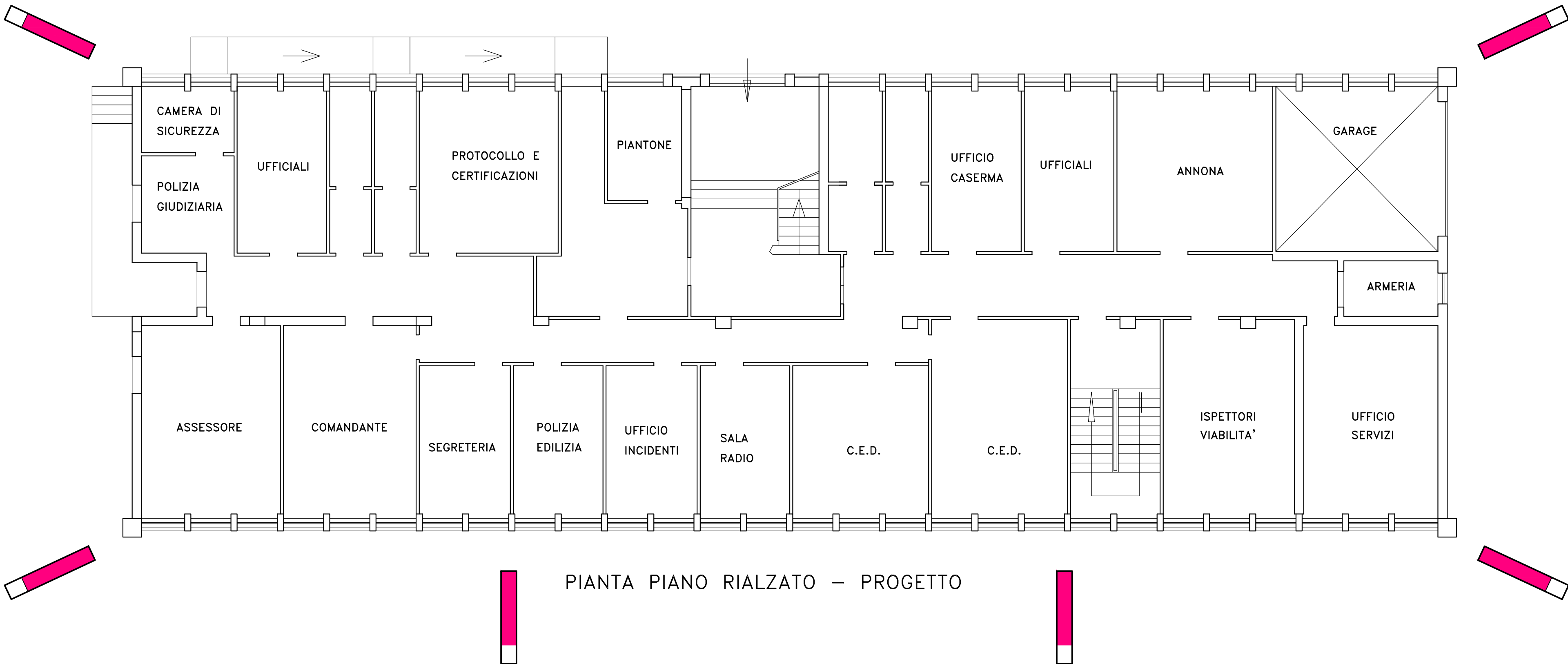
PIANTA PIANO RIALZATO – PROGETTO