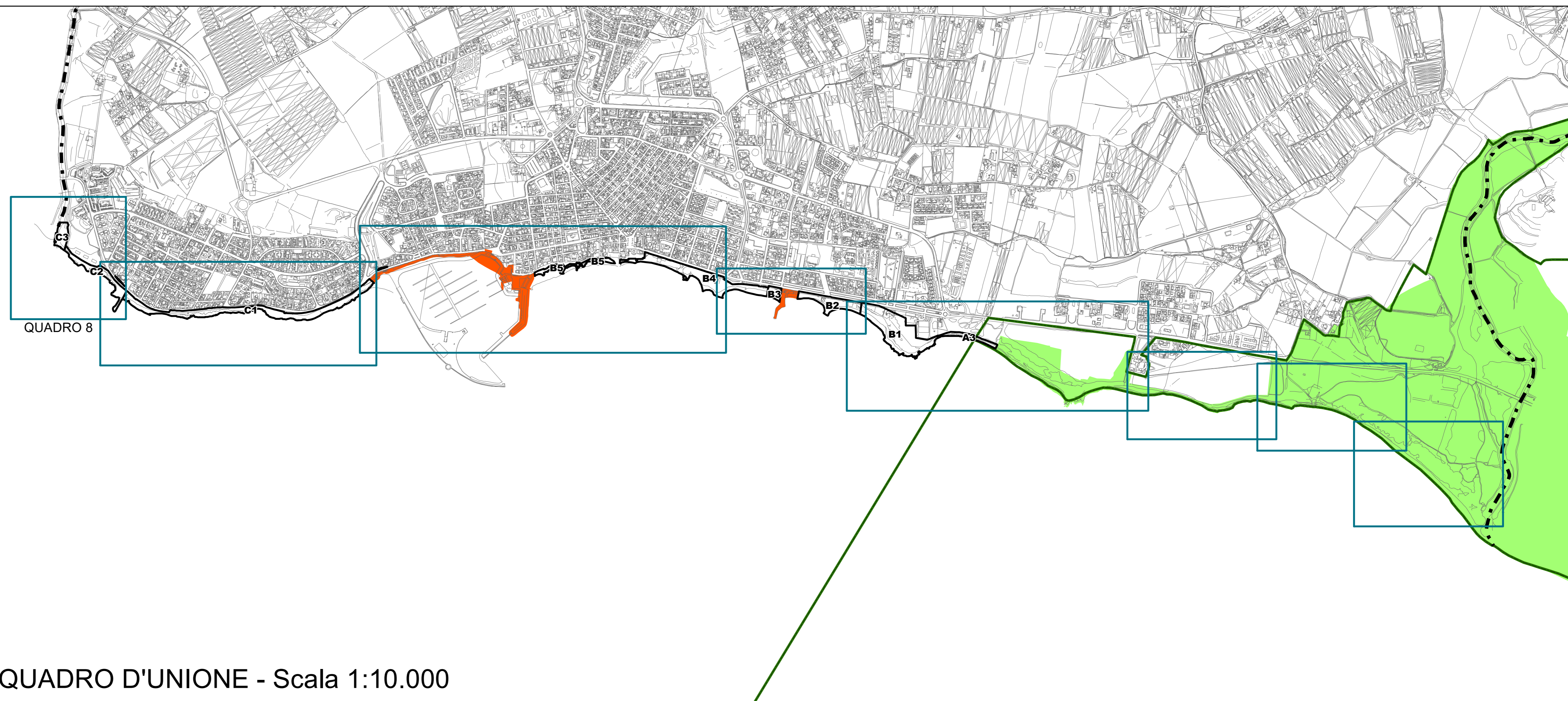
QUADRO D'UNIONE - Scala 1:10.000

PROGETTISTA Arch. Aurelio Barone ELABORAZIONI E RAPPORTO AMBIENTALE Collaborazione esterna Arch. Pianif. Costanza Dipassquale COORDINATORE Responsabile del procedimento Dirigente del Settore IV Arch. Marcello Dimartino L'ASSESSORE ALL'URBANISTICA Salvatore Corallo IL SINDACO Ing. Federico Piccitto Dicembre 2016