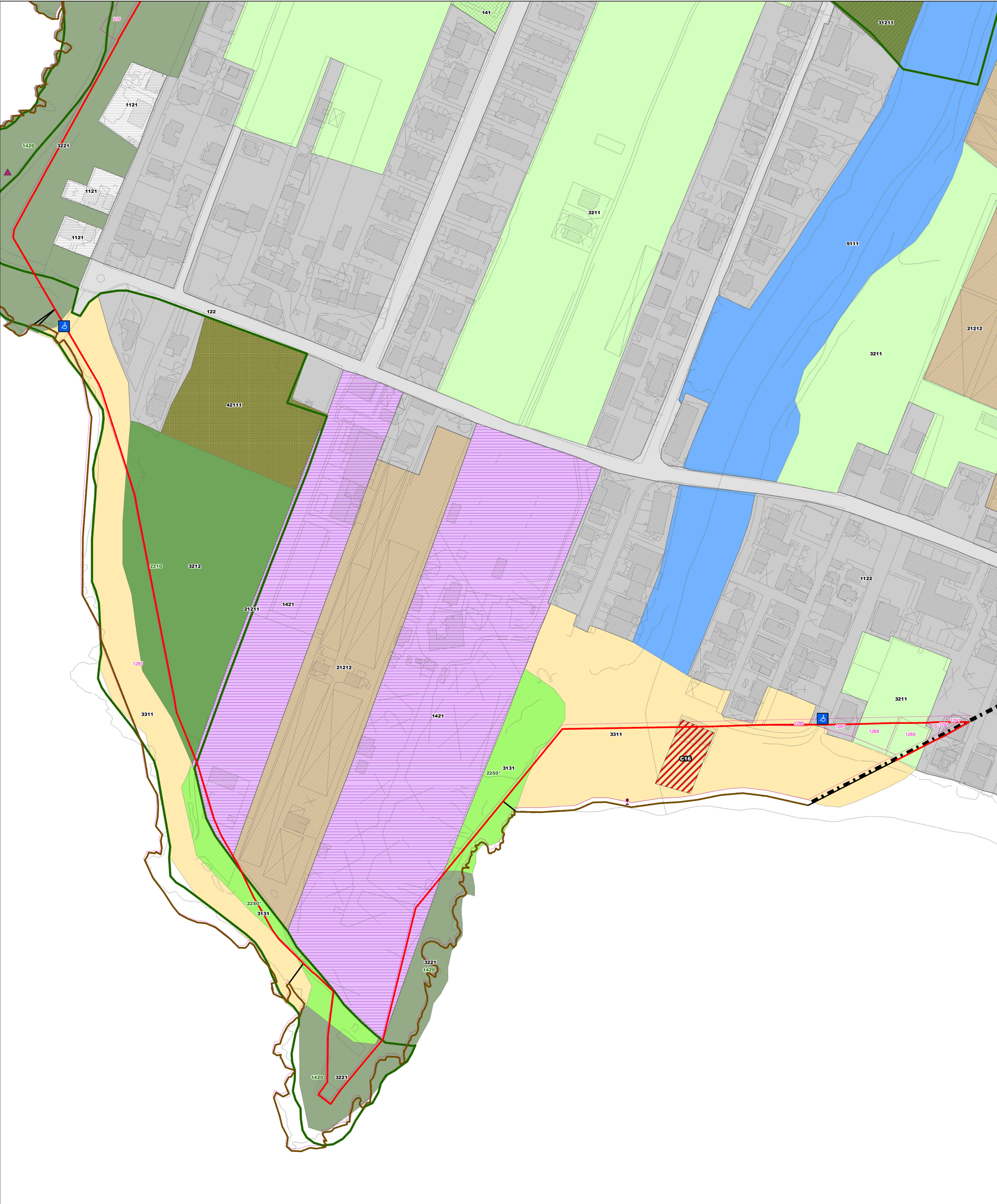
QUADRO 9 - Scala 1:1.000 (Cartografia SIDERSI)