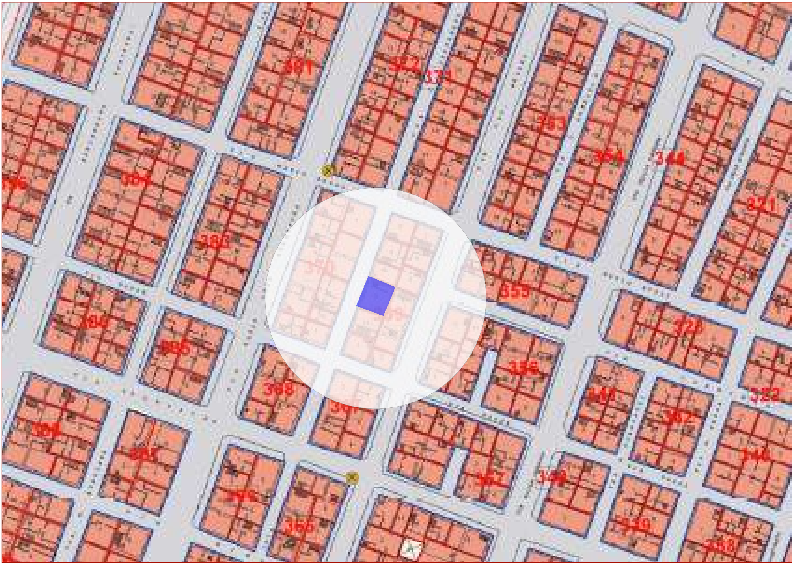
STRALCIO PPE_SCALA 1:500