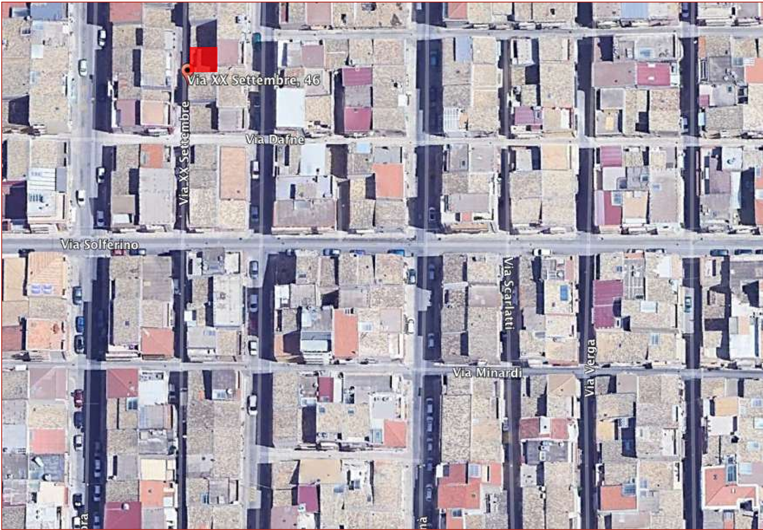
VISTA AEREA_SCALA 1:500