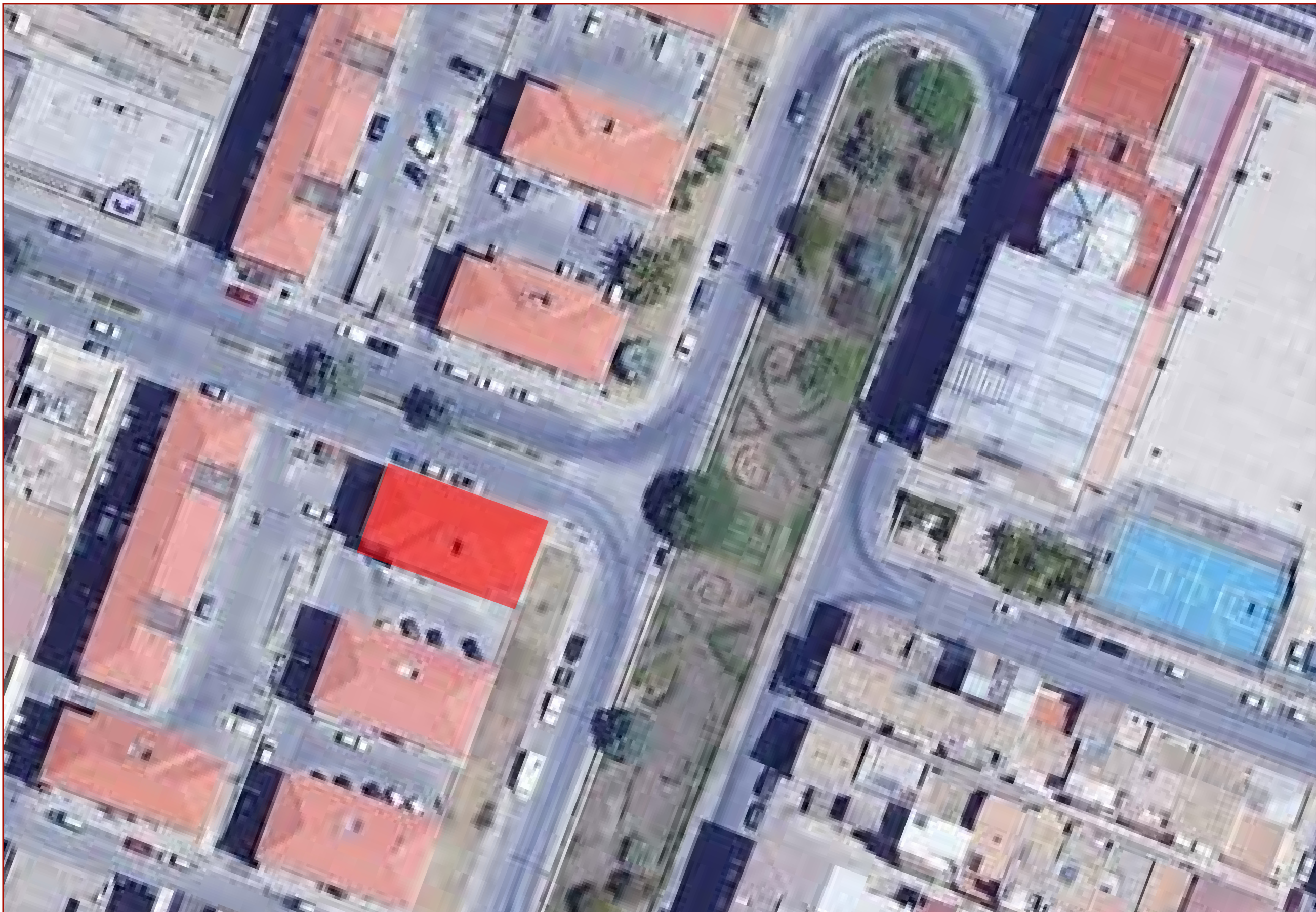
VISTA AEREA_SCALA 1:500