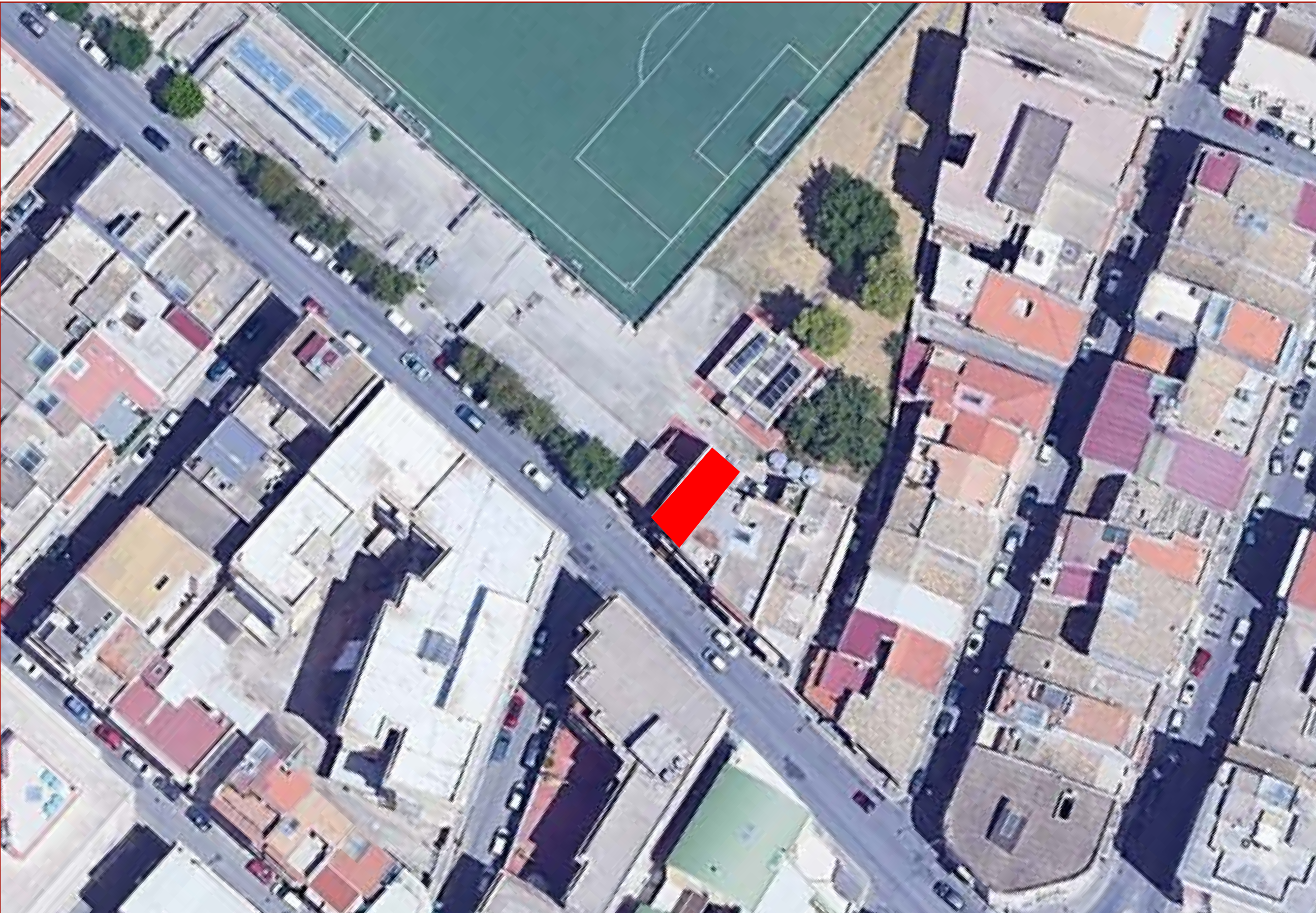
VISTA AEREA_SCALA 1:500