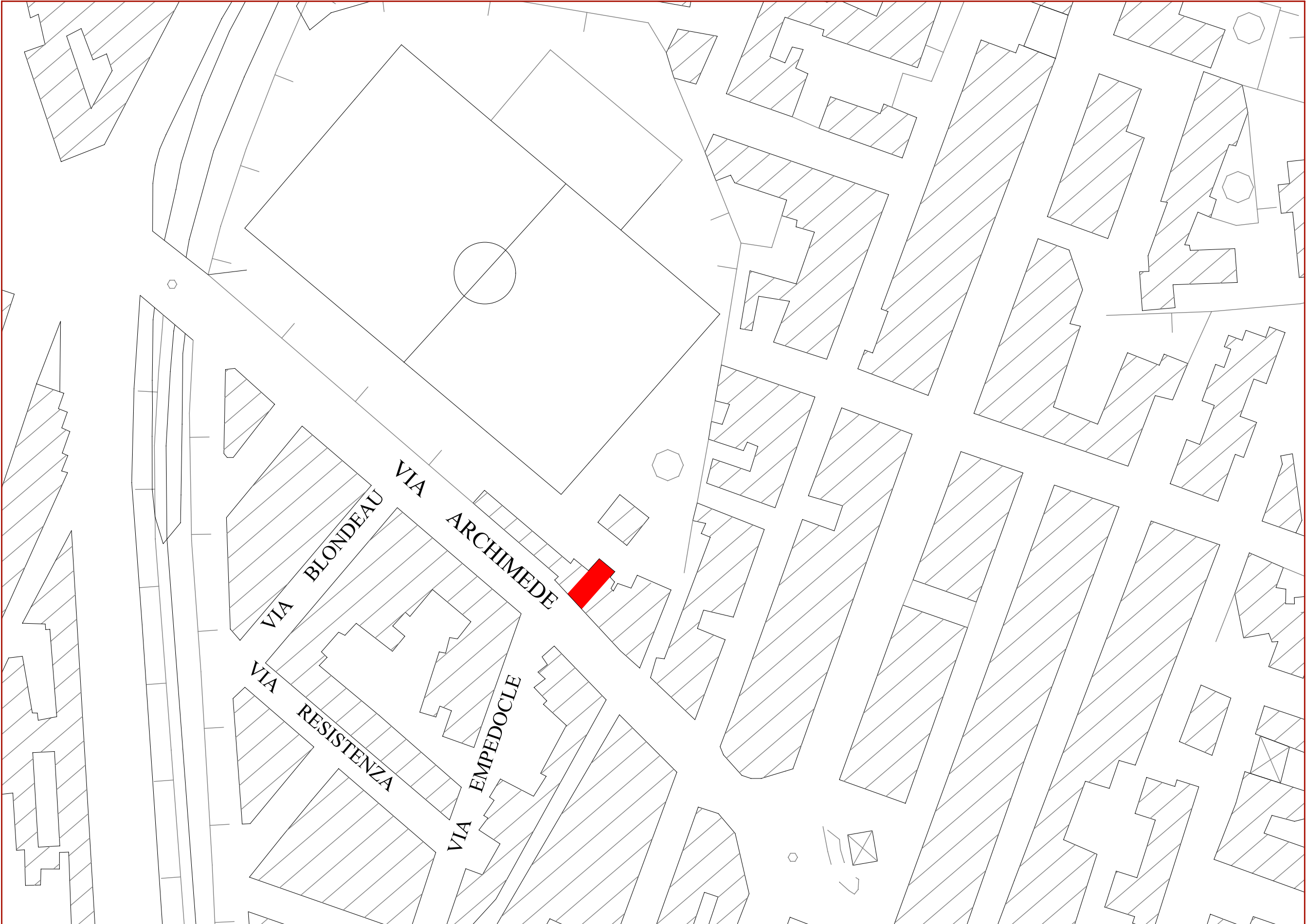
STRALCIO AEROFOTOGRAMMETRICO_SCALA 1:1000