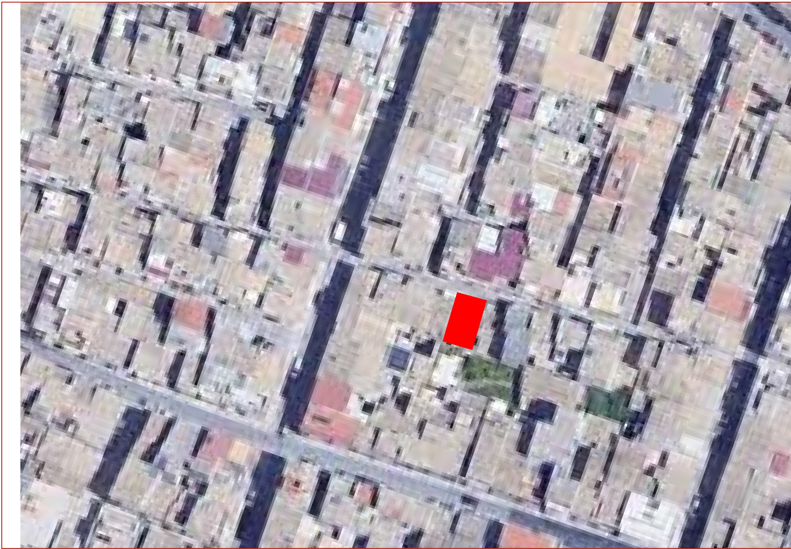
VISTA AEREA_SCALA 1:500