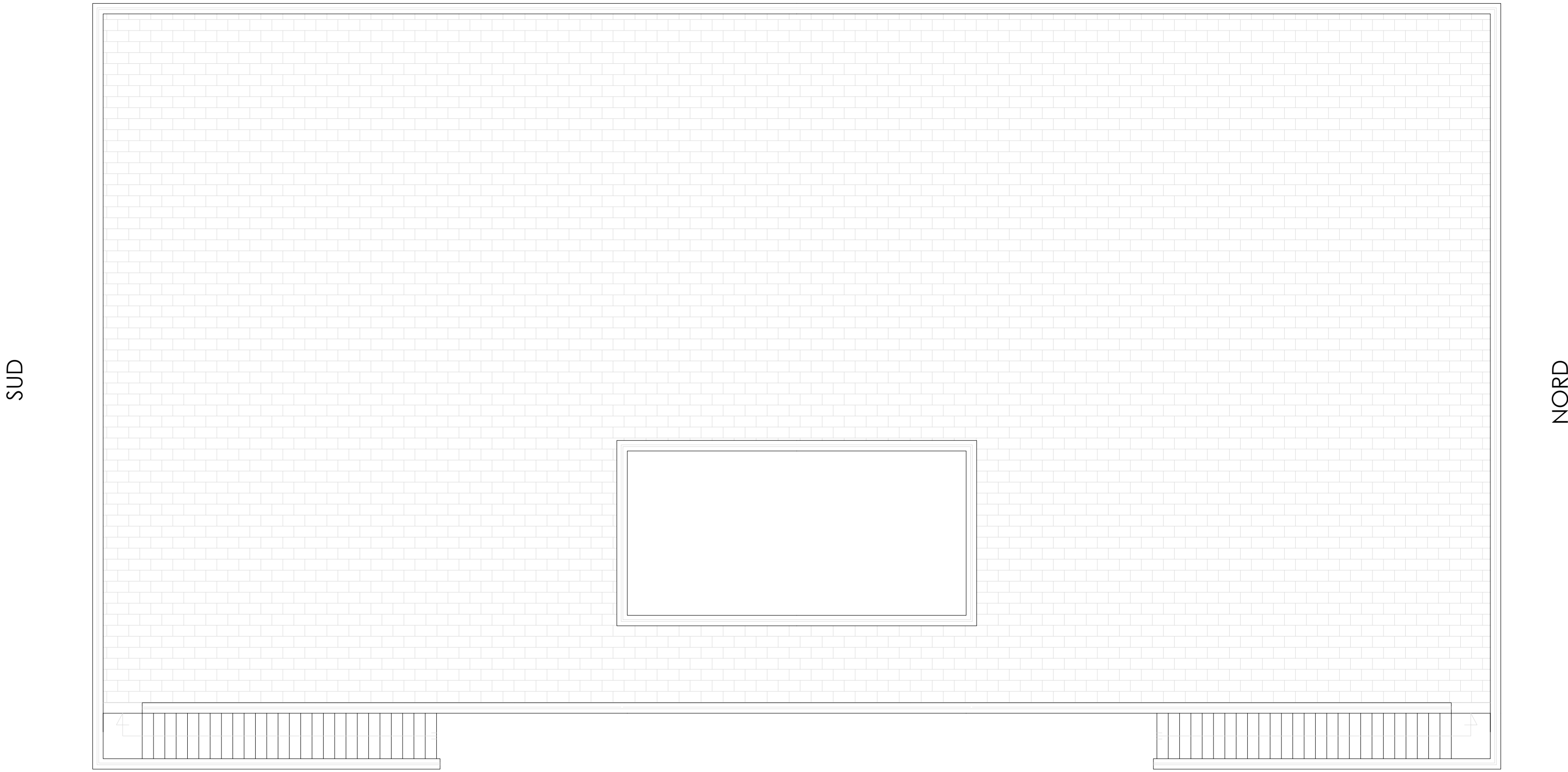
PIANTA scala 1:100