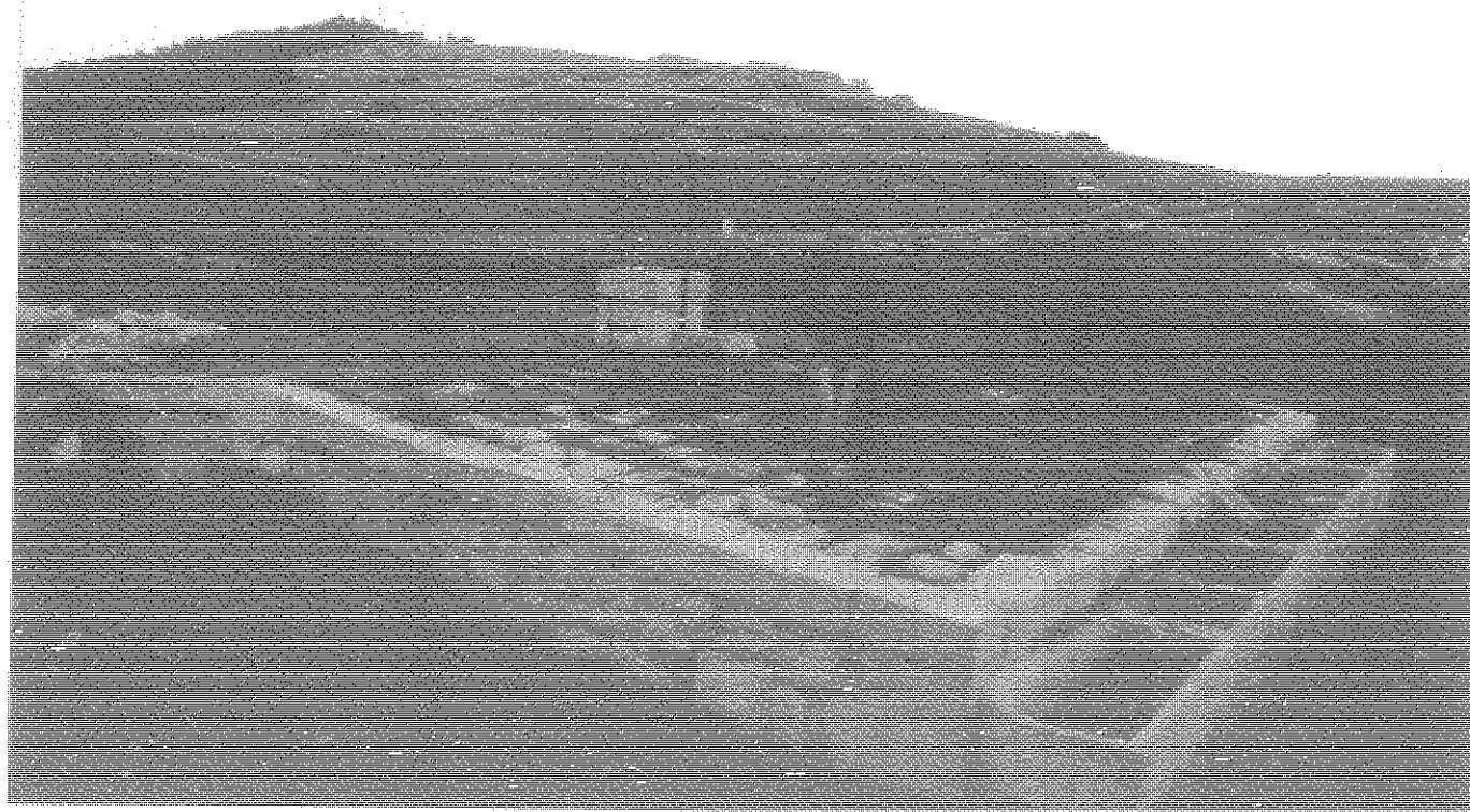
NEVIERA DI CHIARAMONTE - MONTEROSSO