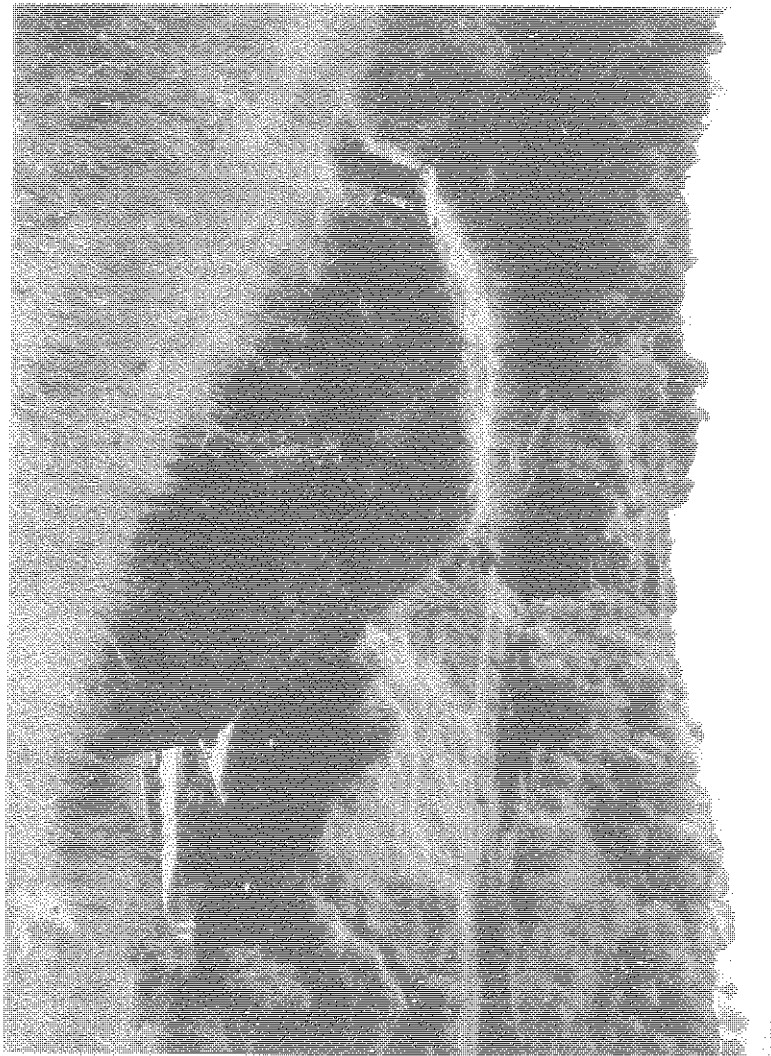
NEVIERO DI BUCCHERI