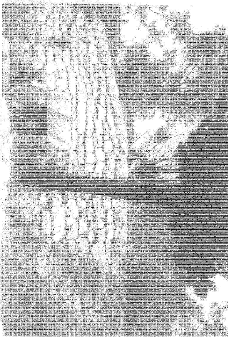
NEVIERO DI CHIAROMONTE G.