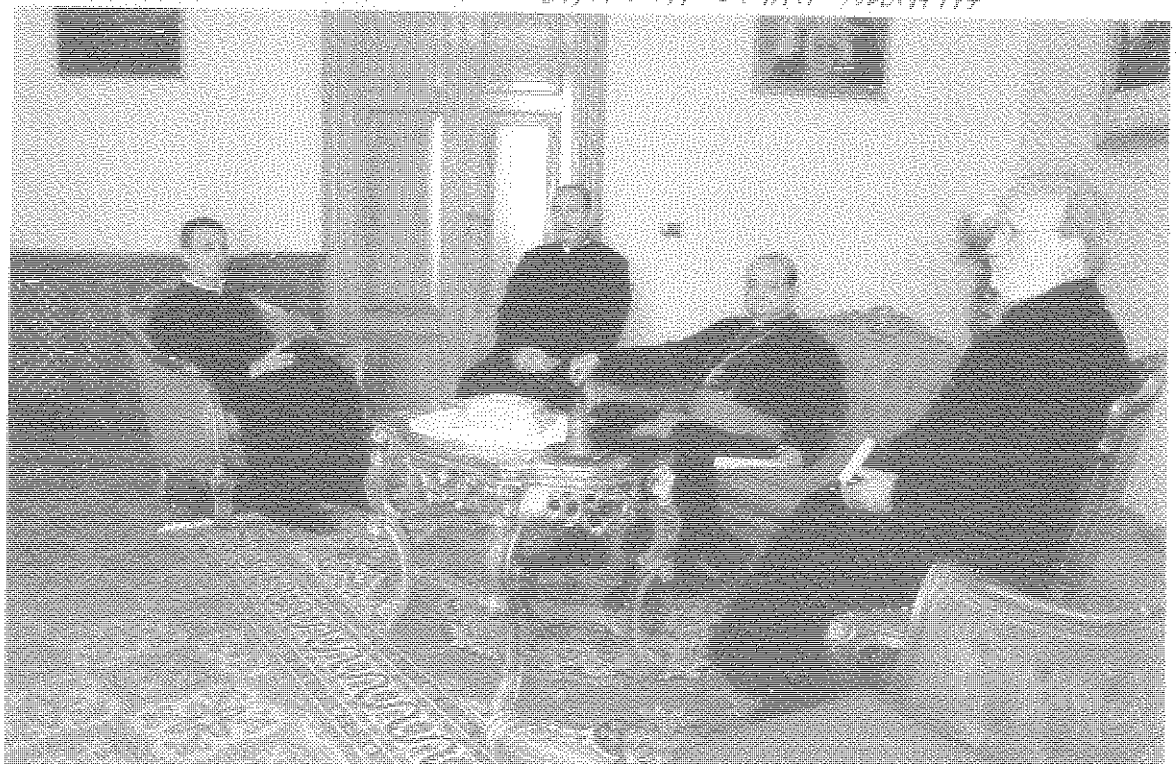
SOCIETA' VESCOVO DI CATANIA - FAM. ALIATA