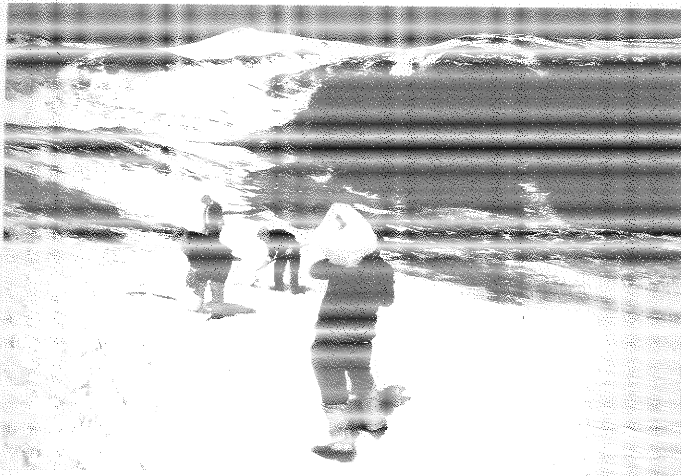
SCENA : RACCOLTA DELLA NEVE