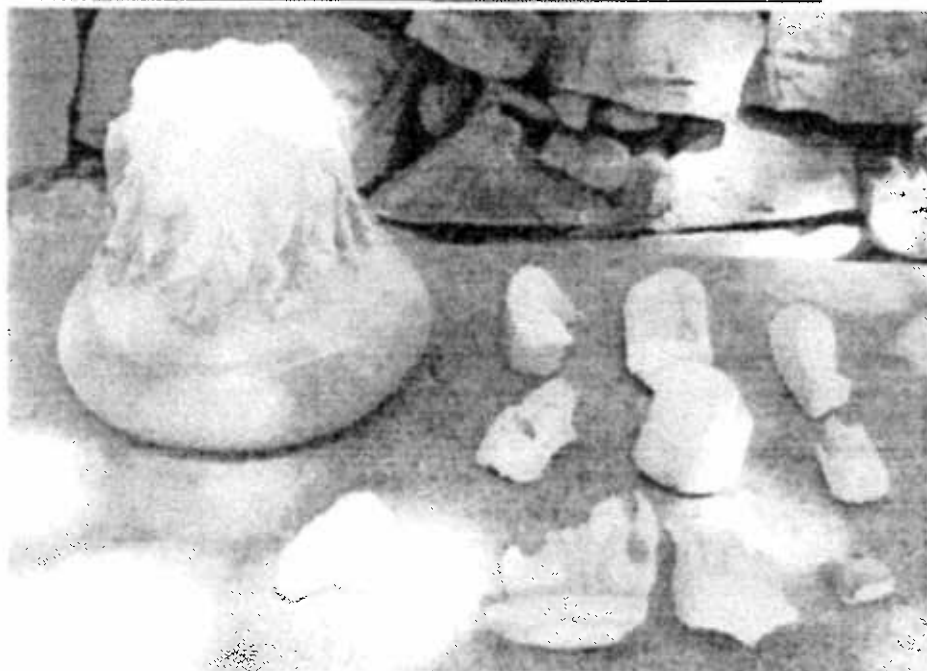
Stato di conservazione della bifora e del capitello