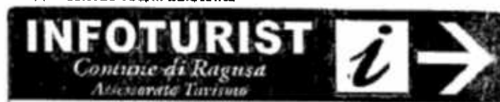
Pos.4 25x125 Totem Esistente

Seconda Rotatoria Intersezione x Circonvallazione x via Vasco De Gama