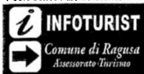
Pos.5 30x60 Palo Esistente

via Vasco De Gama Intersezione B. Brin da Aggregare a segnale Polizia Municipale