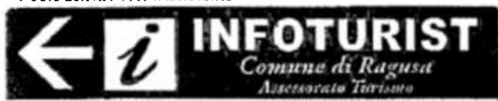
Pos.3 25x125 Totem Esistente

Seconda Rotatoria Intersezione x Circonvallazione x via Vasco De Gama