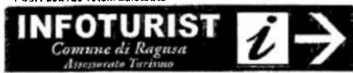
Pos.1 25x125 Totem Esistente

da Ragusa Rotatoria Balcone Mazzaroli per Circonvallazione