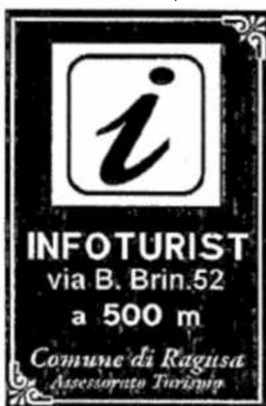
Pos.7 60x90 + Palo 3,30

da Porto Turistico L.re Bisani x via B. Brin