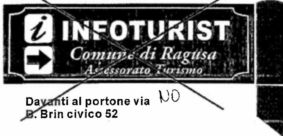
Pos. 8 25x80 Alluminio Bifacciale + Palo

NO Davanti al portone via B. Brin civico 52