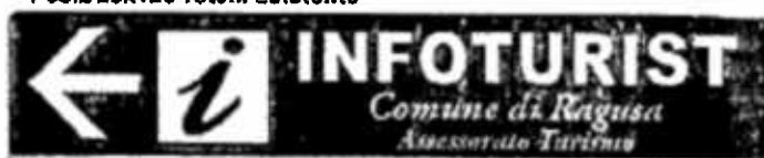
Pos.2 25x125 Totem Esistente

da Ragusa Rotatoria Balcone Mazzaroli per Circonvallazione