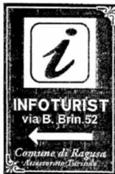
Pos.6 60x90 + Palo 3,30

da Piazza Duca d.Abruzzi inizio via B. Brin