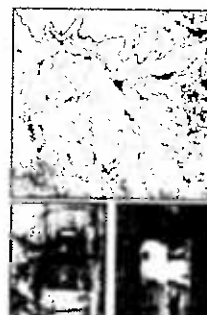
Parco delle Mura - Casella rossa - Osservatorio