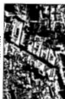
Carreria di Commercio