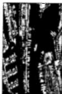
Acquario - Magazzini del cotone