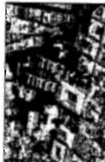
Palazzo Tursi, Palazzo Rosso