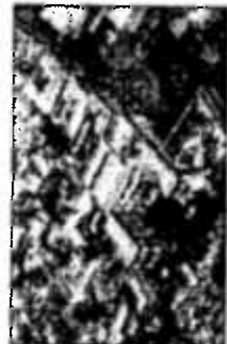
Palazzo Ducale - Piazza De Ferrari