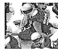
Le immagini Uiguri ammanettate

Londra-Pechino scontro sui video degli uiguri