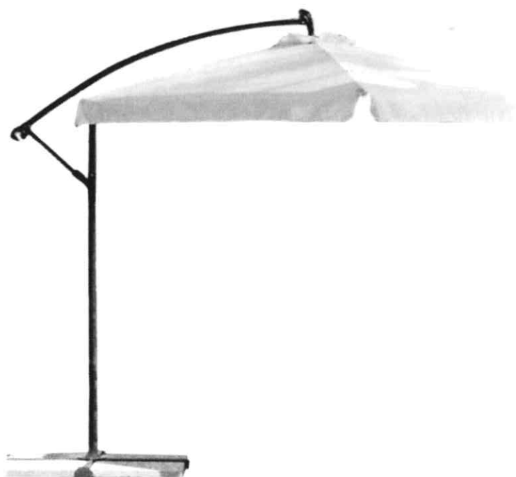
Figura n.2 - Ombrellone mt 2x2 color bianco crema/panna