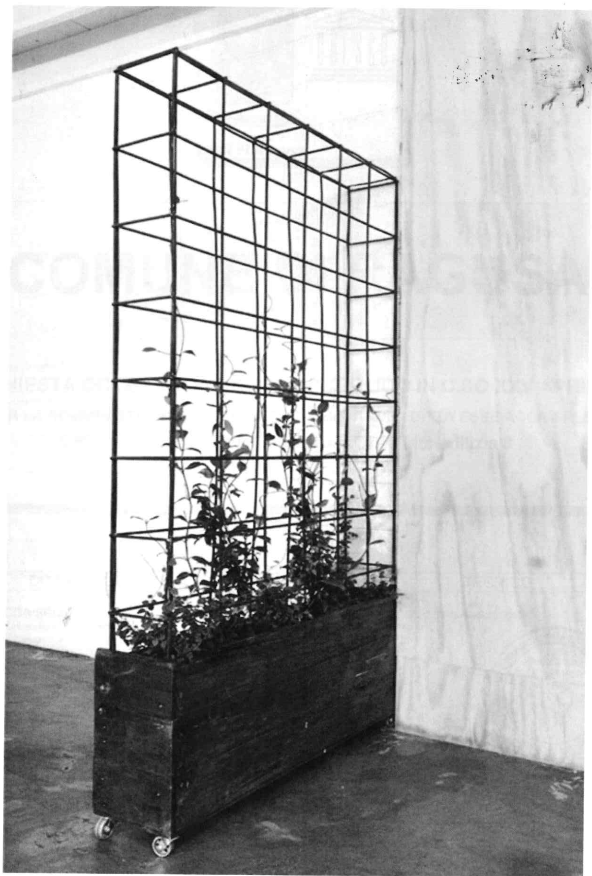
Figura n.4 – struttura tipo con vasi e rete elettrosaldata