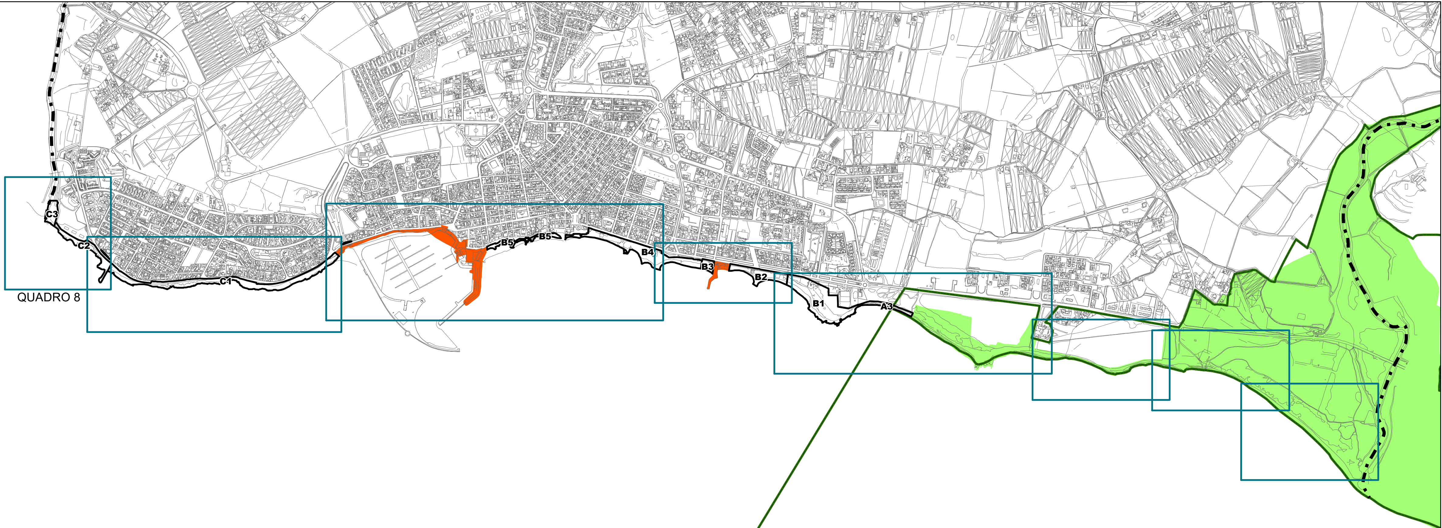
QUADRO D'UNIONE - Scala 1:10.000