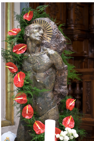
Festa S. Sebastiano