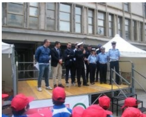
"1° Forum dei Vigilini" - giornata conclusiva corsi educazione stradale presso le scuole presso P.zza S. Giovanni.

Istituti Comprensivi partecipanti: nr. 6 Studenti partecipanti: nr. 520