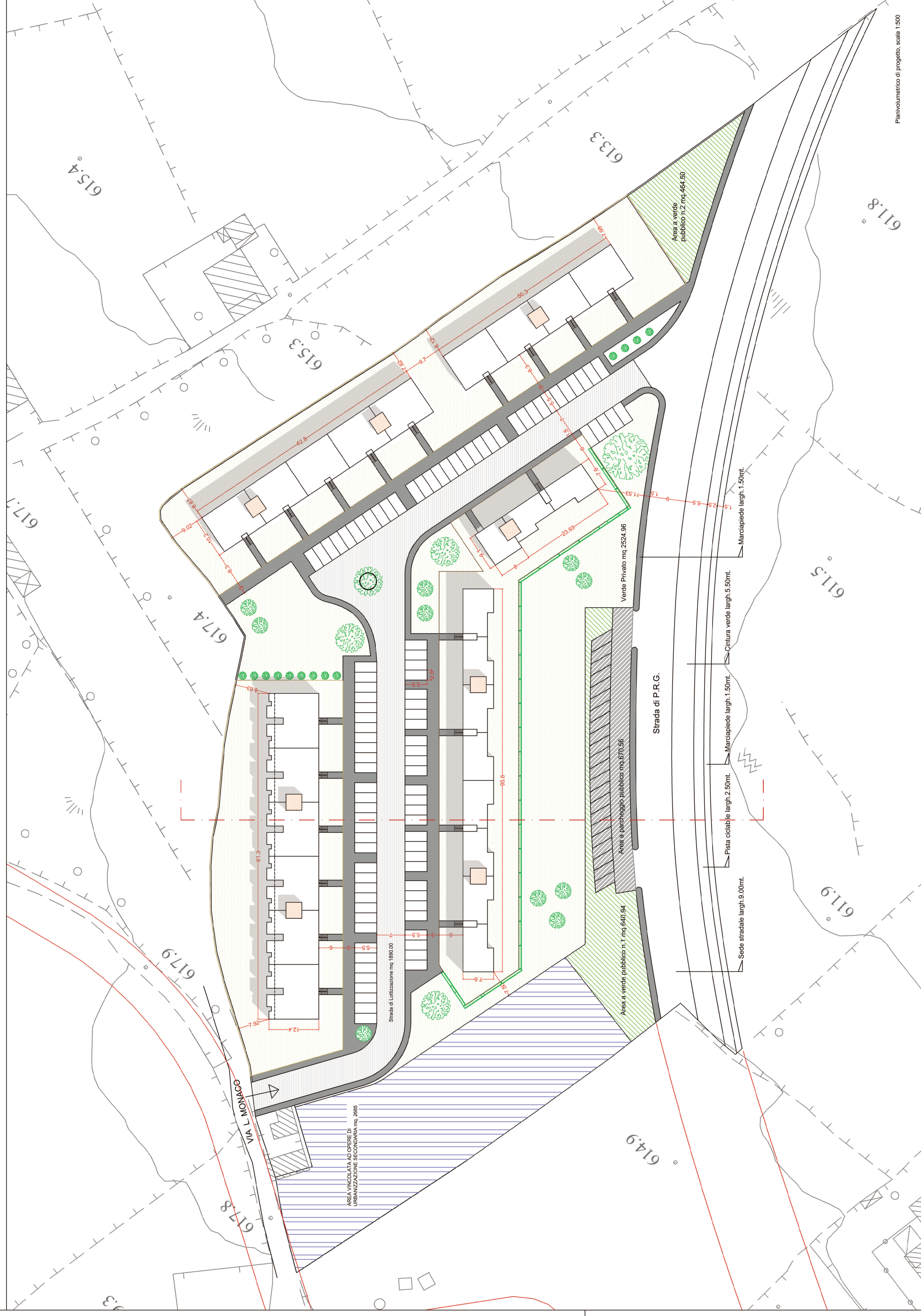
Planivolumetrico di progetto, scala 1:500