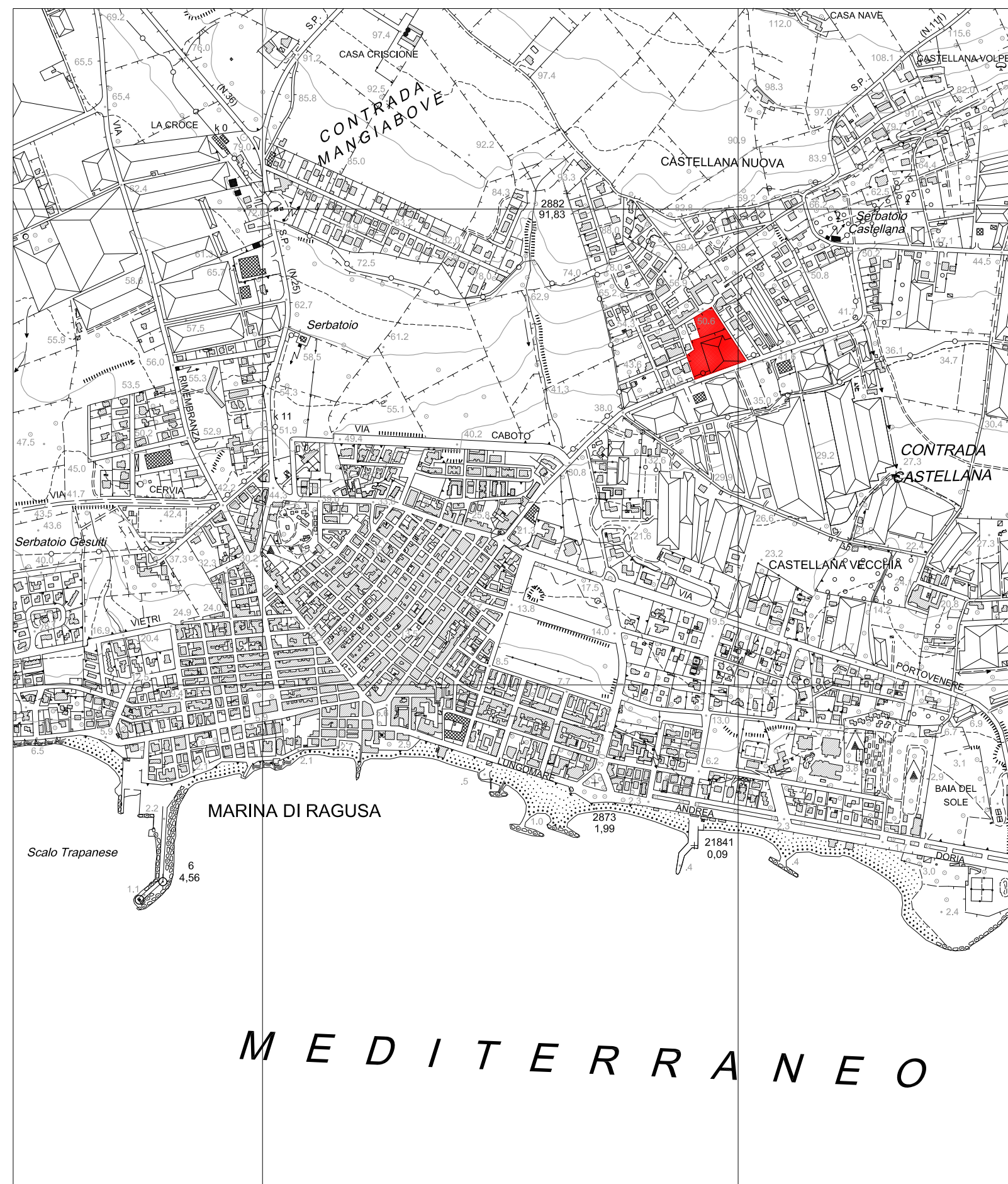
Aerofotogrammetria scala 1:10.000

25-Lug-2013 13.02 Prot. n. T.135468/2013 Scala originale: 1:2000 Dimensione cornice: 778.000 x 552.000 metri Comune: RAGUSA/A Foglio: 259 2 Particelle: 79.310