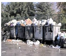
Iblea Ambiente Srl

IL COMUNE DI RAGUSA controlla la società Iblea Ambiente Srl. Partecipa inoltre al Consorzio per l'Area di Sviluppo Industriale (ASI), al Consorzio Universitario della Provincia di Ragusa e al Consorzio Ricerca Filiera Lattiero-Casaria (CoRFiLaC).