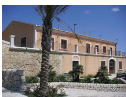
Il Consorzio Ricerca Filiera Lattiero-Casaria (CoRFiLaC)

è stato costituito nel 1962 per agevolare l'insediamento di attività artigianali e industriali sul territorio. Gli enti che vi aderiscono sono l'Assessorato Industria Regione Siciliana, la Provincia Regionale di Ragusa, la Camera di Commercio di Ragusa, i 12 comuni della Provincia, l'Associazione degli Industriali di Ragusa, la Banca Agricola Popolare di Ragusa, l'ANCE (Associazione Nazionale Costruttori Edili e la SOSVI (Società di Sviluppo Ibleo). I servizi forniti alle realtà industriali e artigianali insediate sono la rete idrica e fognaria, con impianto di depurazione in contrada Lusìa, e un ampio Centro Direzionale con ufficio postale, banca, mensa interaziendale, bar e ristorante. Presso il Centro Direzionale trovano la propria sede anche l'Assindustria, la CNA, la Cassa Edile e l'Ufficio Tecnico Provinciale.