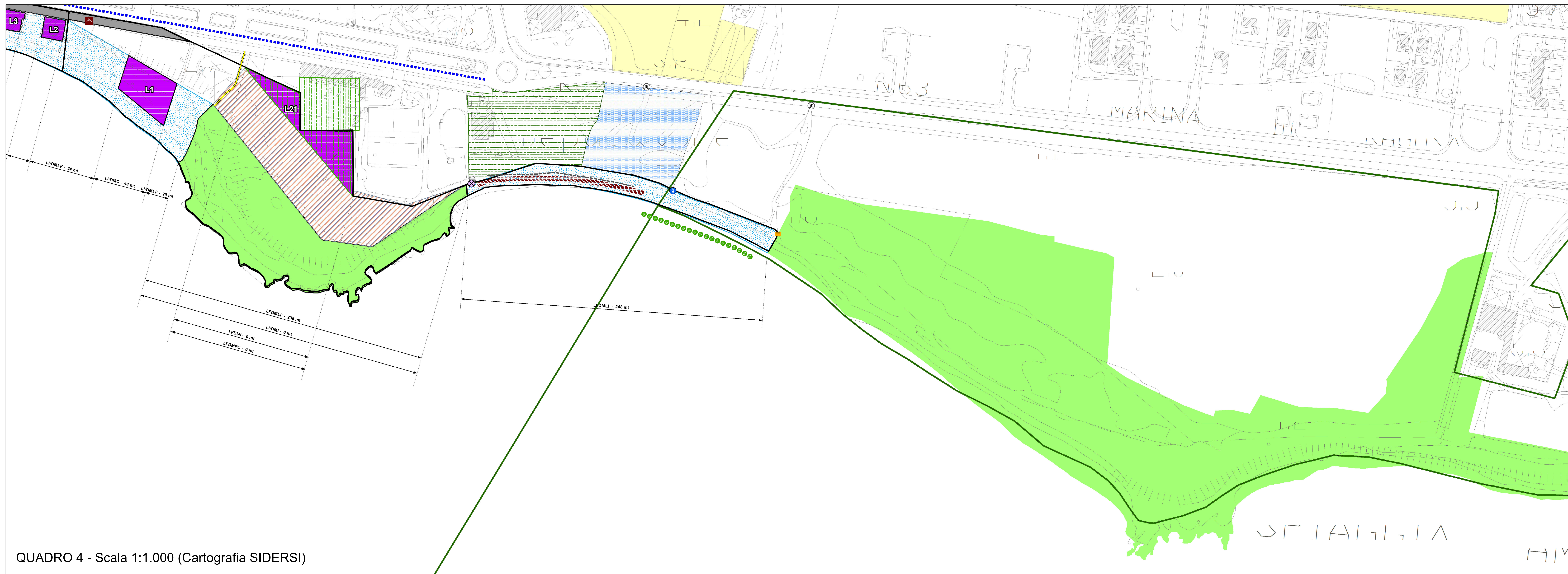
QUADRO 4 - Scala 1:1.000 (Cartografia SIDERSI)