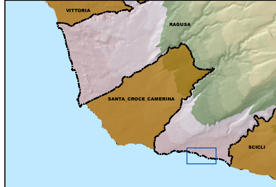
Tavola emendata giusta Deliberazione C.C. n.75 del 29/10/2015

PROGETTISTA Arch. Aurelio Barone ELABORAZIONI E RAPPORTO AMBIENTALE Collaborazione esterna Arch. Pimil Costanza Diprosquale