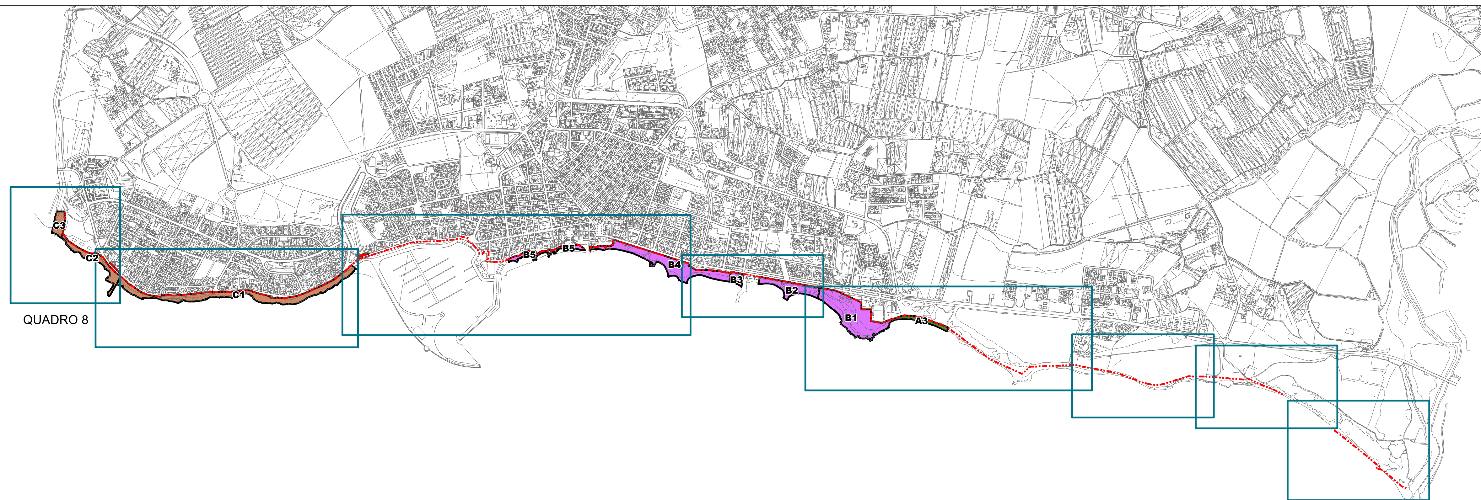
QUADRO D'UNIONE - Scala 1:10.000