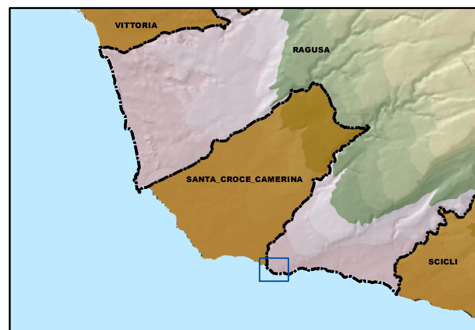
Tavola 2.4 Componenti ambientali e paesaggistiche Litorale Marina di Ragusa (quadro 8)

PROGETTISTA Arch. Aurelio Barone ELABORAZIONI E RAPPORTO AMBIENTALE Collaborazione esterna Arch. Pianif. Costanza Dipasquale